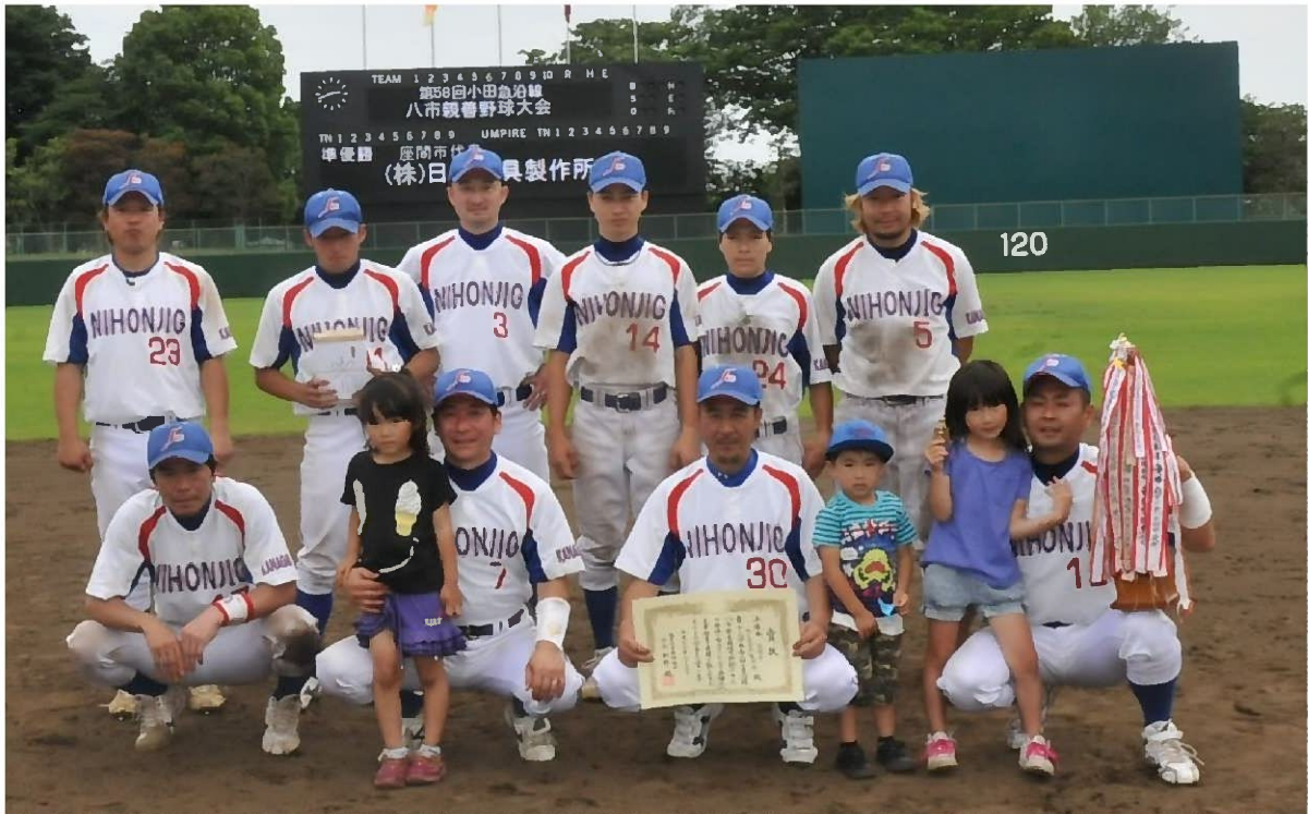
準優勝 (株)日本治具製作所 (座間市)