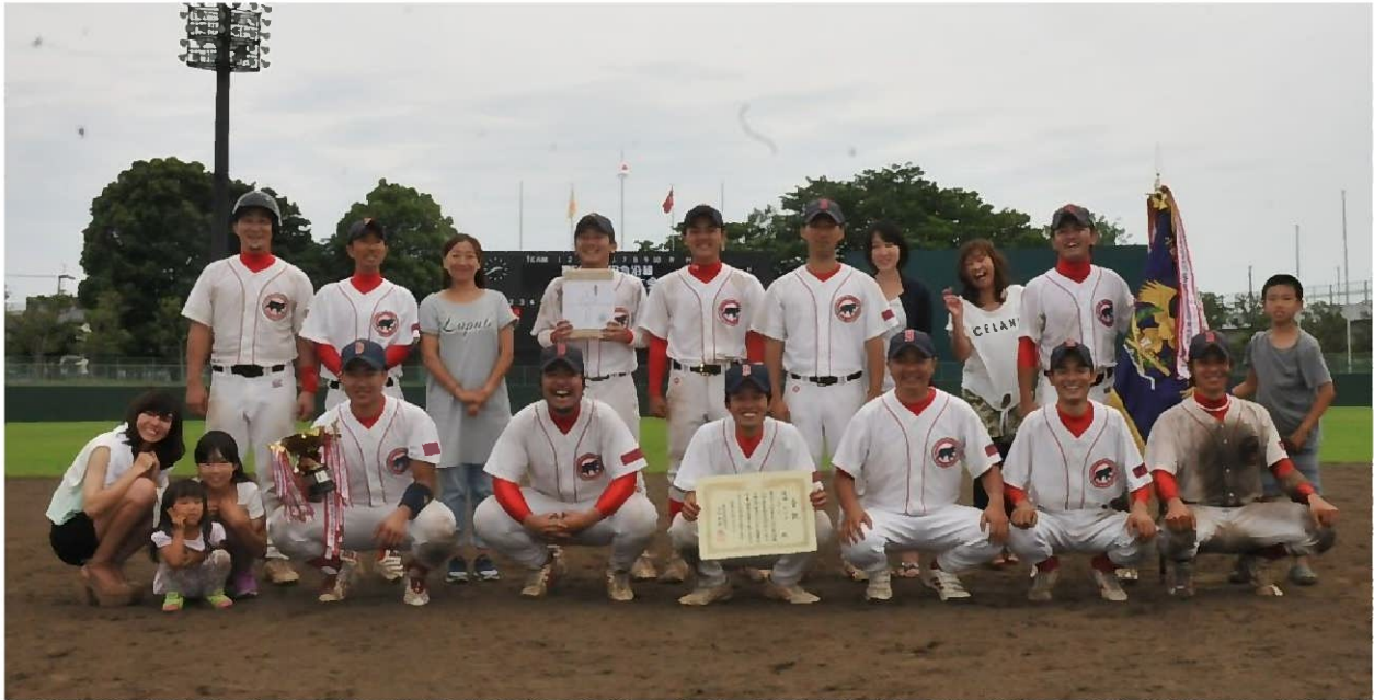
優勝 ベアーズ (町田市)